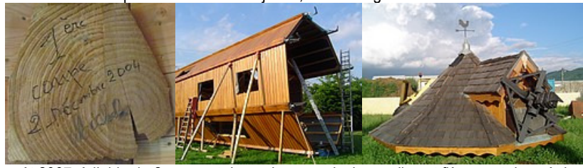
août 2007, à l'aide de 2 grues et de quelques amis, le moulin est fièrement dressé dans le ciel. La toiture repose sur une couronne, ce qui lui permet de pivoter à 360°.