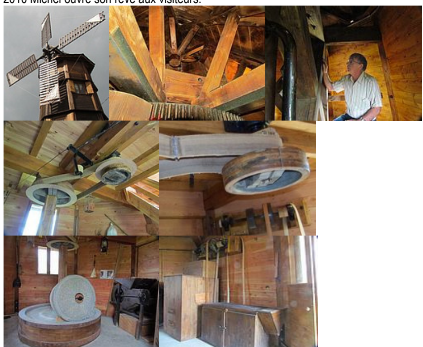
les ailes tournent, la meule écrase les grains de blé, le tamis filtre la farine... le rêve est devenu réalité. Michel attend votre visite...